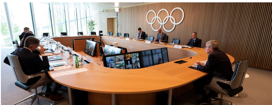
Réunion de la CE à distance depuis la Maison Olympique.