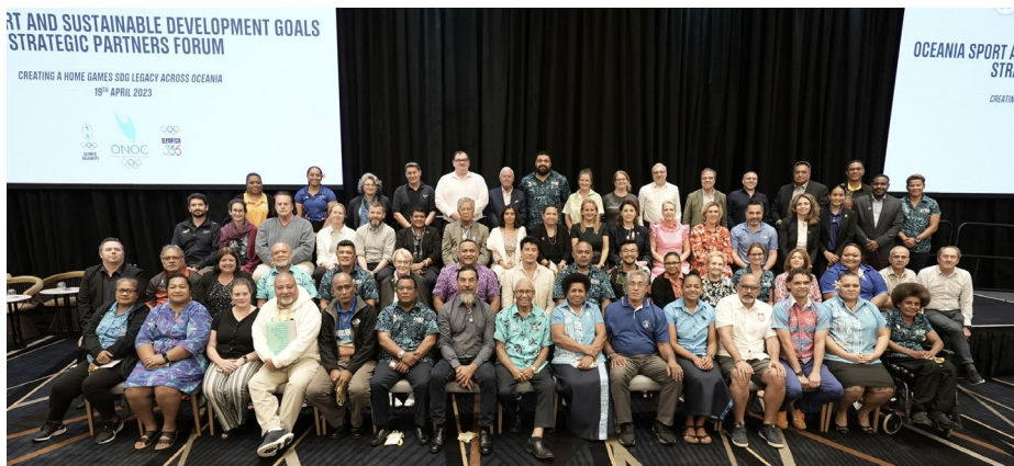
Forum des partenaires stratégiques pour le sport et le développement durable à Brisbane.