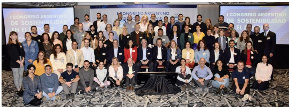
Participants au premier congrès argentin sur la durabilité dans le sport.