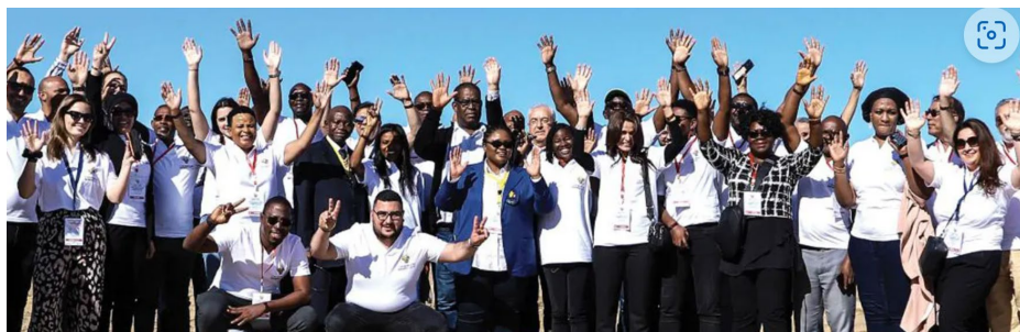
Jeux Africains de plage 2023 – Rencontre des chefs de mission à Hammamet.

Olympiques Rio 2016. À la fin de son 2e mandat à la tête de World Rugby en 2016, il s'est concentré sur la candidature de Paris aux Jeux Olympiques de 2024 en tant que coprésident aux côtés de Tony Estanguet. Depuis 2018, il était président d'honneur du comité d'organisation de Paris 2024. Lapasset a reçu le prix Vernon Pugh pour Services distingués lors de la cérémonie des World Rugby Awards en 2019, ainsi que l'Ordre olympique en 2022 pour sa contribution en faveur du Mouvement olympique. Communiqué complet ici . Lire également ici le texte de Paris 2024.