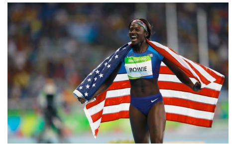
Tori Bowie célébrant sa médaille d'argent du 100m, Rio 2016.