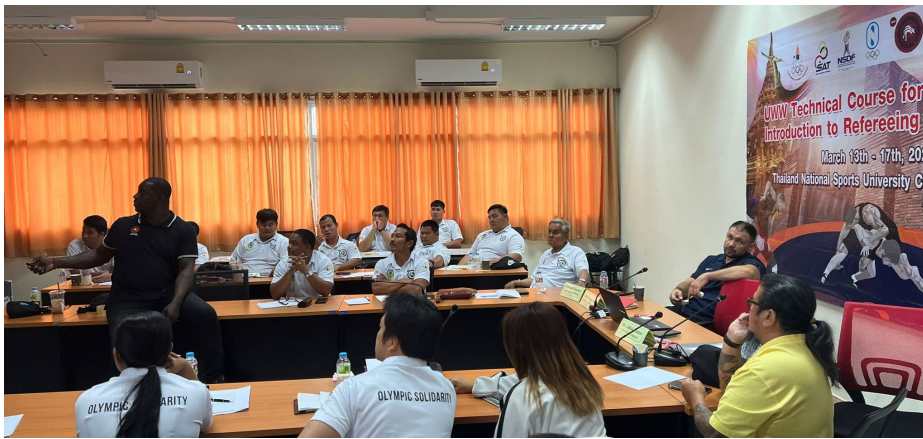
Cours UWW pour entraîneurs en Thaïlande.