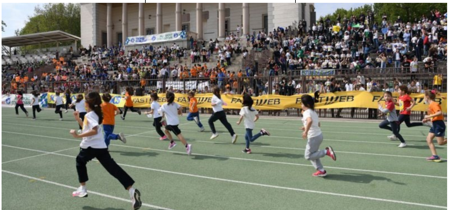
Jeunes participants à une édition précédente du "Trofei di Milano".