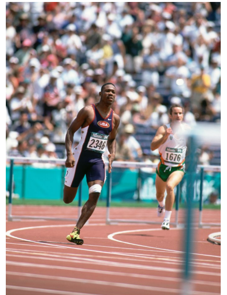
Calvin Davis dans le 400m haies, Atlanta 1996.