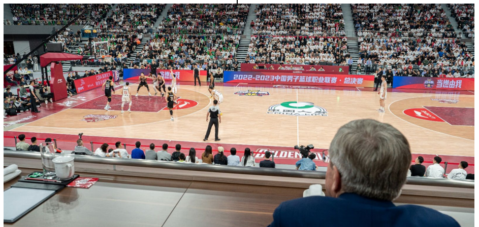
Le président Bach a assisté à la finale de la ligue chinoise de basketball.

Plus tard dans la soirée, Thomas Bach a assisté à la première finale de la ligue chinoise de basketball. L'équipe locale, les Zhejiang Golden Bulls, a perdu le match 99:107 contre les Liaoning Flying Leopards devant son public dans une salle pleine à craquer, qui servira également de site de compétition pour les Jeux asiatiques. Le président du CIO a ensuite reçu un appel téléphonique du légendaire joueur de basketball Yao Ming, qui est aujourd'hui