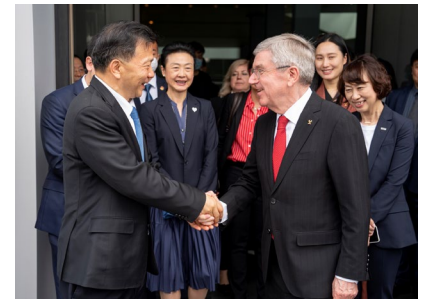
Visite au siège de CMG.