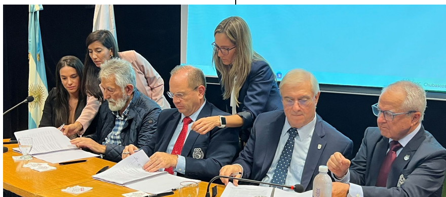
San Luis, officiellement ville hôte des Jeux sud-américains de la jeunesse 2025.

Le 5 mai à Buenos Aires (Argentine), la ville argentine de San Luis est devenue officiellement la ville hôte des Jeux sud-américains de la