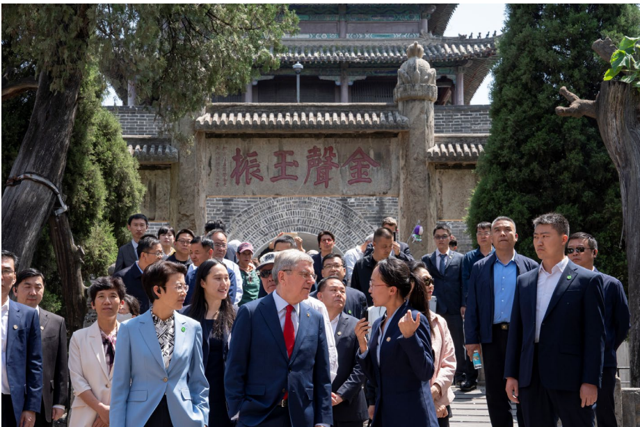
Visite du temple de Confucius à Qufu.