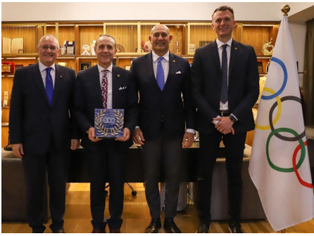
Les dirigeants du CIJM en visite en Albanie.