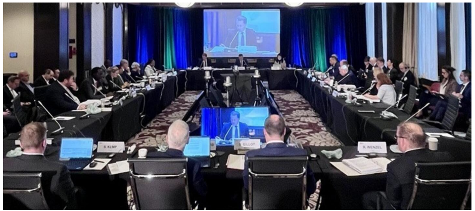
Réunion du comité exécutif de l'AMA à Montréal.