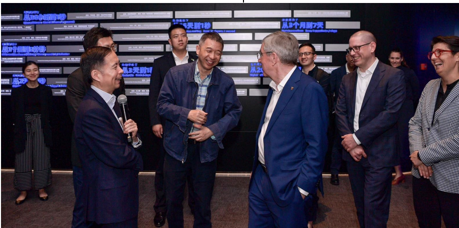
Visite au siège du partenaire TOP, Alibaba.

Le grand philosophe avait lui aussi souligné l'importance de la forme physique et d'un mode de vie sain. Durant sa visite, Thomas Bach a pris connaissance d'une citation de Confucius : "La volonté de gagner, le désir de réussir, l'envie d'atteindre votre plein potentiel ; ce sont les clés qui ouvriront la porte à l'excellence personnelle."