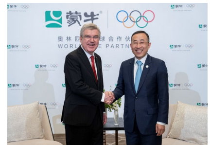
Le président et le PDG du partenaire TOP, Mengniu.

Mouvement olympique qui est de réunir les athlètes de tous les CNO dans une compétition pacifique sans aucune discrimination. Le premier ministre Li a fait remarquer que le CIO joue un rôle important dans le maintien de la paix mondiale et la promotion du progrès de l'humanité, en particulier au cours de cette période difficile et pendant la pandémie. Il a souligné la coopération fructueuse avec le CIO et a insisté sur l'importance du développement du sport et sur la volonté de la Chine d'apporter une contribution encore plus grande au Mouvement olympique et à sa mission unificatrice. Lire communiqué complet ici .