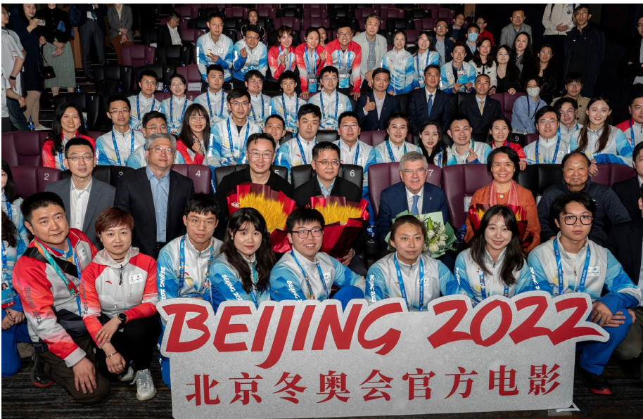
Séance de projection du film officiel de Beijing 2022 avec des athlètes chinois et des volontaires des Jeux.