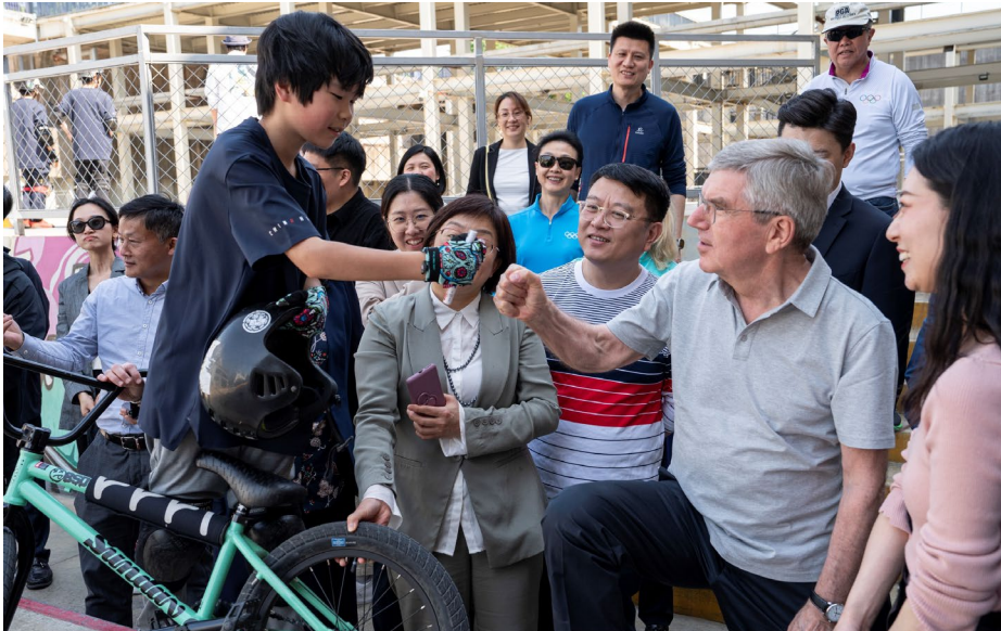
À Shanghai, le président Bach avec la prochaine génération de 'riders' chinois de BMX.

président de la Fédération chinoise de basketball.