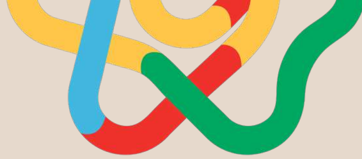
TABLEAU CONNECTÉ DU CNOM