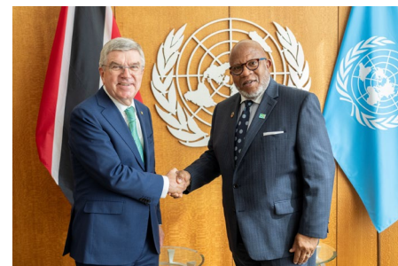
Le président du CIO et le président de l'Assemblée générale des Nations Unies.

discuter des prochains Jeux Olympiques Paris 2024, de la situation géopolitique et du rôle unificateur du sport et des Jeux Olympiques en particulier.