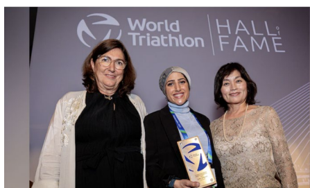
Remise du prix d'excellence 2023 de la commission des femmes de World Triathlon.

À la veille des finales de la série de championnats du monde de triathlon 2023 qui se sont déroulées du 22 au 24 septembre à Pontevedra (Espagne), le 36e Congrès de World Triathlon a vu la participation de délégués de 84 fédérations nationales présents ainsi que de 46 autres fédérations en mode virtuel. L'ordre du jour comprenait entre autres un rapport d'activités et le calendrier des manifestations pour 2024. Plus d'infos ici . Auparavant, quatre nouveaux membres ont été intronisés au panthéon de la gloire de la FI lors d'un dîner de gala. À découvrir ici . Lors du même gala, le prix d'excellence 2023 a été remis par la commission des femmes de la