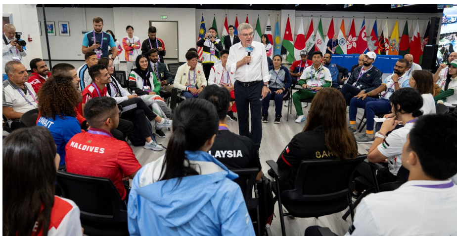
Discussion avec des athlètes participant aux Jeux asiatiques.

Avant la cérémonie d'ouverture des Jeux asiatiques, le président du CIO a rencontré le premier ministre de la République de Corée, Han Duck-soo. Les deux hommes ont discuté des