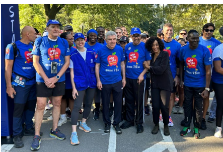
Le président du CIO avec le directeur général de l'OMS et Paul Tergat, au Walk the Talk New York: Health for All Challenge.

À l'invitation du Prince Albert II, membre du CIO, le président Thomas Bach a assisté à une réception organisée par la Fondation de la Princesse Grace-USA.