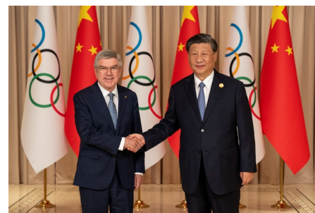
Le président du CIO, Thomas Bach, et le président chinois, Xi Jinping.