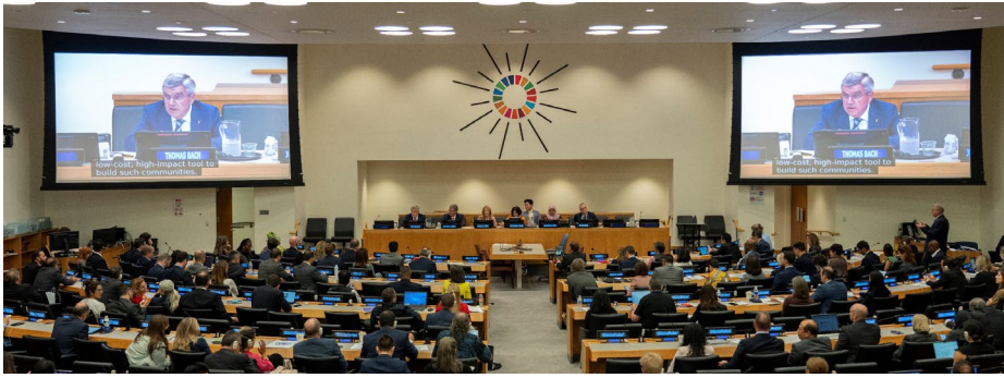
À New York, le président Bach s'est exprimé lors de l'événement d'ONU-Habitat.

triple lauréat d'un Grammy Award et fan olympique, qui a donné un court concert célébrant le lien entre le sport et la musique.