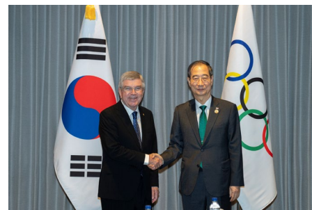
Thomas Bach et le premier ministre de la République de Corée.

président et membre de la commission des athlètes du CIO. Parmi les participants se trouvait une athlète afghane qui vit aujourd'hui à l'étranger et qui fait partie des 17 athlètes afghans en lice aux Jeux. Elle a remercié le président du CIO pour l'aide que l'instance olympique a apportée et continue d'apporter à la communauté olympique d'Afghanistan.