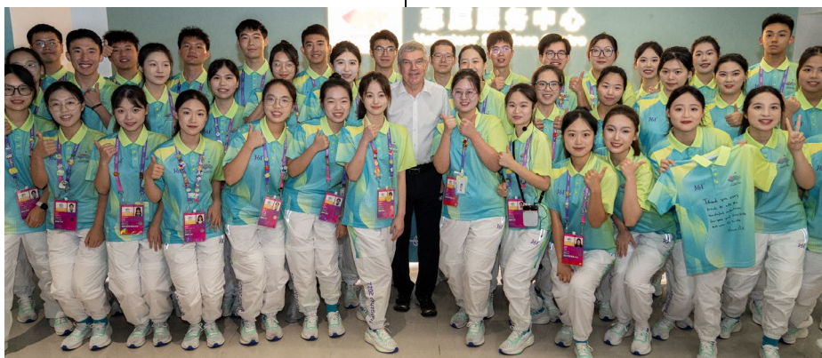
Le président avec les volontaires des Jeux asiatiques.

À l'occasion de sa visite dans le village, le président du CIO a rencontré des volontaires et des athlètes de plus de 40 CNO participants. Lors de sa rencontre avec les athlètes, Thomas Bach était accompagné de Seung Min Ryu et Zhang Hong, respectivement vice-