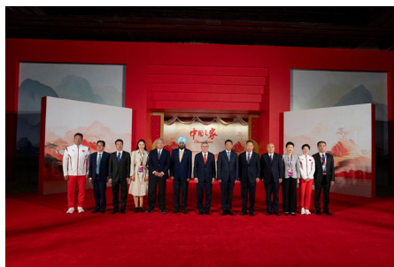
Inauguration de la Maison Chine lors des Jeux asiatiques.

l'accent sur la poursuite de l'excellente coopération entre le CIO et Alibaba, la transformation numérique du sport et l'impact de l'intelligence artificielle. Thomas Bach a par ailleurs visité le pavillon d'Alibaba installé dans le village des Jeux asiatiques.