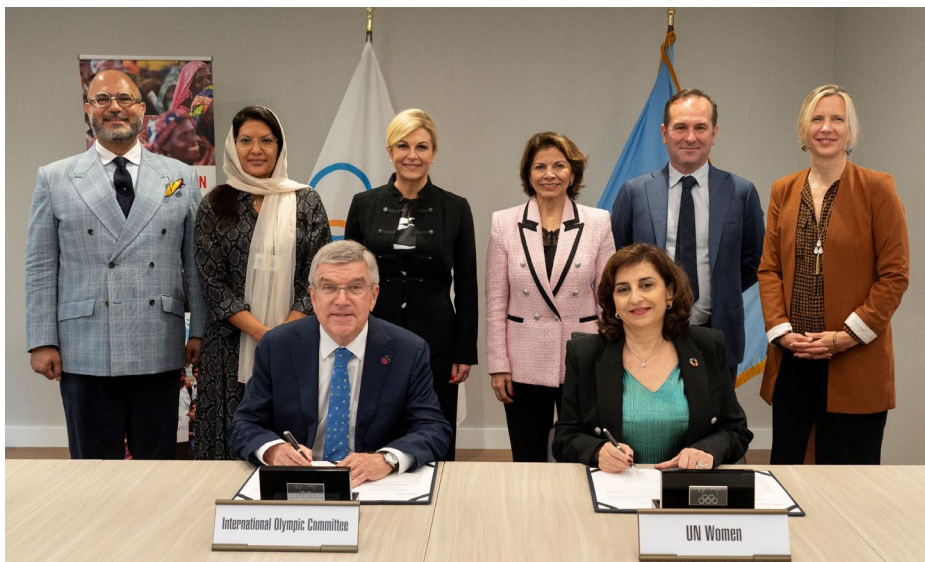
Signature du nouveau protocole d'accord entre le CIO et ONU Femmes.