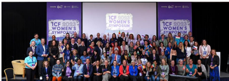
Les participants au Symposium de l'ICF sur les femmes à Dublin.

Une nouvelle déclaration de consensus du CIO, publiée dans le British Journal of Sports Medicine, souligne le risque pour les sportifs d'un syndrome affectant la santé et la performance, causé par un déséquilibre entre les calories ingérées et brûlées pendant l'exercice - connu sous le nom de RED-S (Relative Energy Deficiency in Sport). Lire plus ici .