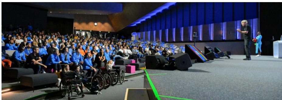
Séance de questions-réponses lors du 11 e Forum international des athlètes à Lausanne.