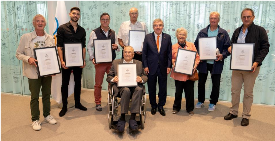
Le président du CIO et les olympiens du canton de Vaud.

président et les réunions feront l'objet de nouvelles sur Olympics.com.