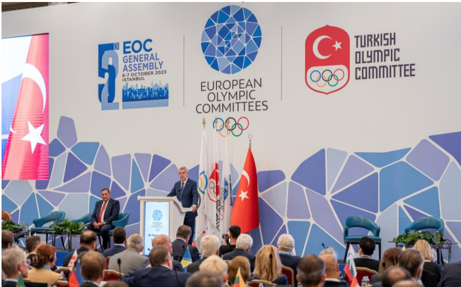
Le président Bach s'est adressé à la 52e Assemblée générale des COE.