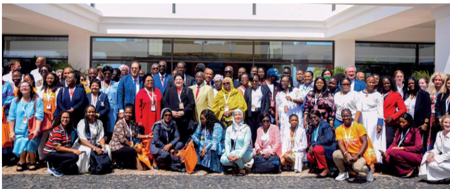
Les participants au 2e Forum de l'ACNOA sur l'égalité des genres à Cabo Verde.

Lire également ici le compte-rendu sur la visite de la délégation de l'ACNOA, à Hangzhou (République populaire de Chine) à l'occasion des Jeux asiatiques.