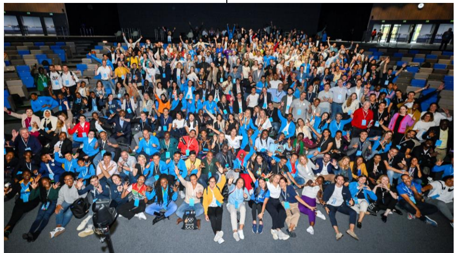
Les participants au 11e Forum international des athlètes à Lausanne.

Du 8 au 17 octobre, le président du CIO sera à Mumbai (Inde). Il présidera la réunion de la commission exécutive du CIO, suivie de la 141e Session du CIO. Les activités du