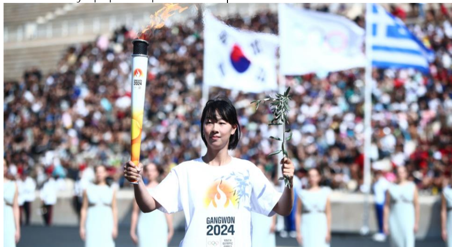
À Athènes, cérémonie d'allumage de la flamme olympique de la jeunesse de Gangwon 2024.