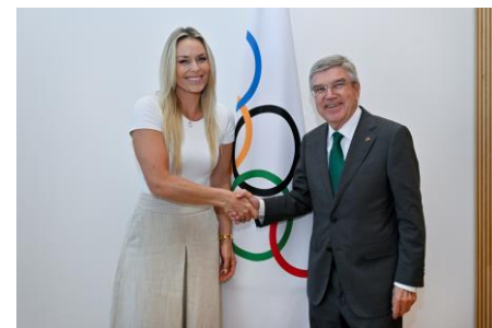
Le président a accueilli Lindsey Vonn.

Plus tôt dans la semaine, le président du CIO a pris part à une séance de questions-réponses approfondie de deux heures avec les représentants des athlètes lors du 11 e Forum international des athlètes tenu à Lausanne. Comme le veut la tradition lors du Forum international des athlètes, le président du CIO est monté sur scène et s'est entretenu directement avec les représentants des athlètes pour répondre à leurs questions – aucun sujet n'étant tabou. La pratique du sport en toute sécurité, les prochains Jeux Olympiques Paris 2024, la participation d'athlètes individuels neutres munis d'un passeport russe ou biélorussien à des compétitions internationales pendant la période de qualification, et la mission des Jeux Olympiques ... autant de sujets abordés lors de cette séance de questions-réponses. Parmi les autres sujets abordés par le président du CIO, citons les suivants : la situation des athlètes dans les pays et régions touchés par les trop nombreuses guerres et conflits dans le monde, la numérisation du sport, avec l'essor de l'intelligence artificielle, la popularité croissante des e-sports, le soutien du CIO à la communauté olympique d'Ukraine, les Jeux Olympiques de la Jeunesse Dakar 2026. Lire communiqué complet ici . Voir également sous 'Commissions'.