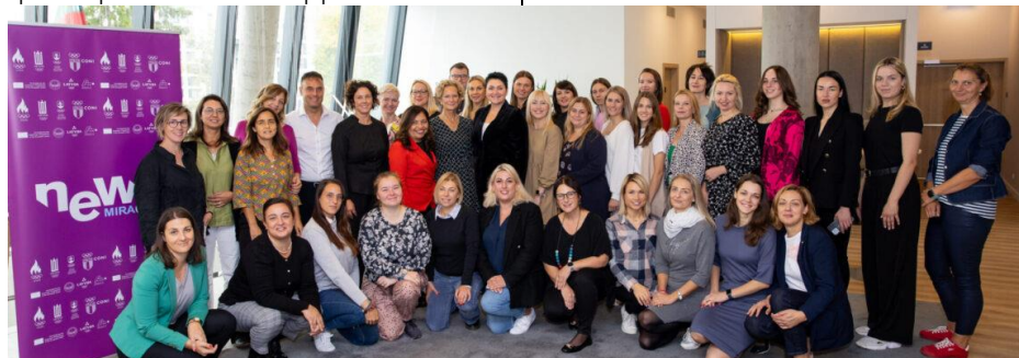
Les participants au projet New Miracle à Vilnius.

Le projet international de leadership féminin dans le sport baptisé New Miracle vient de s'achever dans la capitale lituanienne, Vilnius. Cette séance finale de formation a vu la participation de 37 managers sportives venues de quatre pays. Lancé par le LNOC et d'une durée de deux ans et demi, ce projet était consacré à la promotion du leadership des femmes dans le sport, au développement des compétences nécessaires pour travailler dans les organisations sportives et à la création de contacts. En préparation du projet, un programme gratuit de formation et une plateforme de mentorat pour les managers sportives ont été développés où les participants avaient l'opportunité