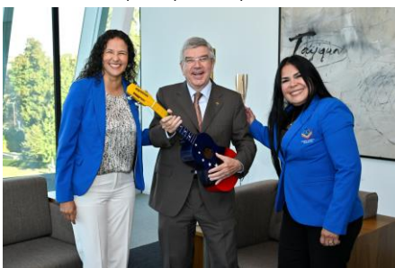
Le président Bach avec la présidente du CNO vénézuélien et la secrétaire générale.