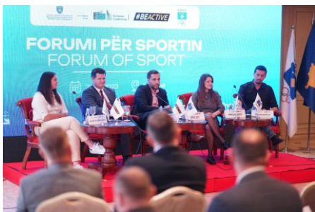
La 5e édition de la conférence 'Forum du sport' à Pristina.