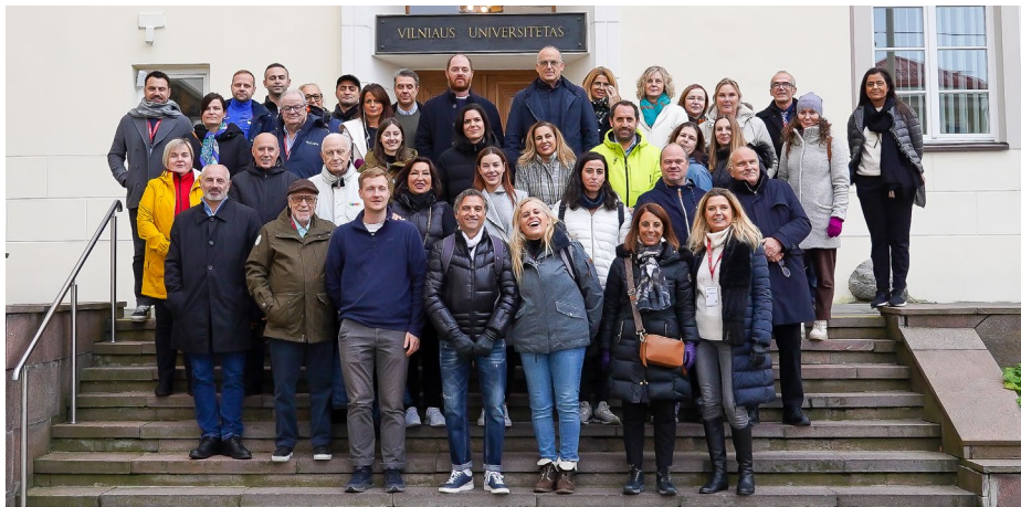
Participants au congrès de l'EOA à Vilnius.