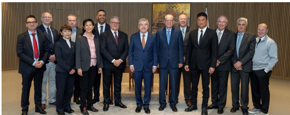
Le président du CIO avec les membres du bureau de la WBSC.