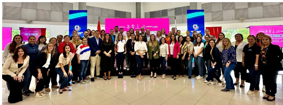
Participants au Forum international 'diversité, inclusion et égalité des genres' à Asunción.