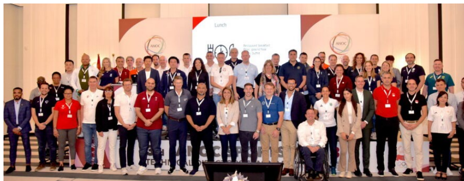
Séminaire pour directeurs techniques et sportifs organisé par l'ACNO à Rabat.