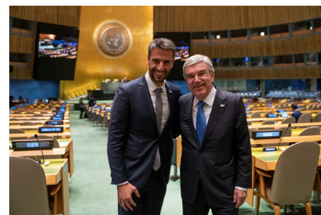
Thomas Bach et Tony Estanguet dans la salle de l'Assemblée générale des Nations Unies.

Trêve olympique". Il a conclu en lançant un appel à l'ensemble des États membres des Nations Unies : "Je vous en conjure, donnons une chance à la paix !"