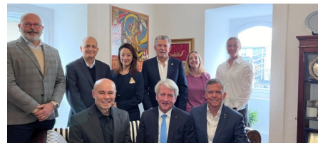
Réunion du groupe de travail ad hoc de l'UIPM.

Le conseil exécutif de l'UIPM a attribué l'organisation du 73 e congrès de l'UIPM à Riyad (Arabie saoudite). Le congrès électif aura donc lieu les 16 et 17 novembre 2024 et pour la première fois dans la capitale du