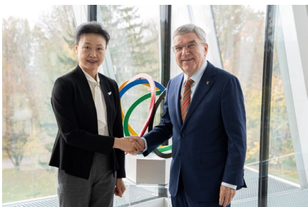
Le président Thomas Bach et Li Lingwei, membre du CIO.

Le président du CIO a évoqué avec Li Lingwei, membre du CIO, plusieurs sujets olympiques parmi lesquels les Jeux Olympiques Paris 2024 et la résolution sur la Trêve olympique adoptée par l'Assemblée générale des Nations Unies.