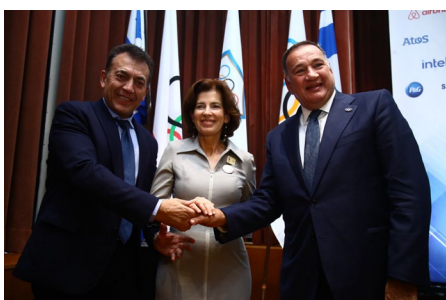
(de g. à d.) Yannis Vrotsis, Laurence Auer et Spyros Capralos.

Lors d'un événement organisé à son siège, le CNO a dévoilé le parcours du relais de la flamme olympique des Jeux Olympiques Paris 2024 sur le