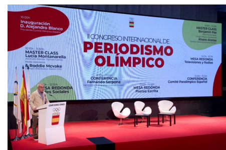
Alejandro Blanco a ouvert le 2e Congrès international de journalisme olympique.