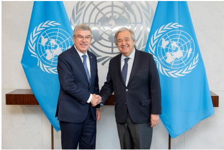
Le président du CIO et le secrétaire général de l'ONU, António Guterres.