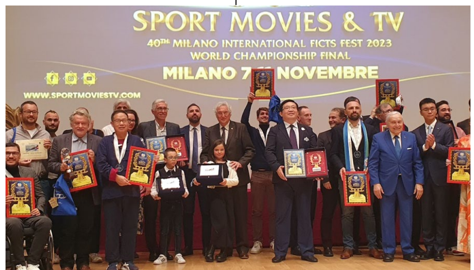
Les lauréats du concours " Sport, Mountain & Olympism – Snow & Ice Sports ".

L'AMA a lancé une nouvelle campagne sur les réseaux sociaux baptisée ' Natural is Enough ' (Fièrement naturel). Par le biais de cette campagne, cofinancée par l'Union européenne, l'AMA invite les jeunes de toute l'Europe à rejoindre le 'mouvement d'entraînement naturel' en évitant l'utilisation de stéroïdes anabolisants. Pour ce faire, l'AMA a sollicité une équipe d'influenceurs dans le domaine de la mise en forme naturelle pour faire passer le message sur les réseaux sociaux. Communiqué complet ici .