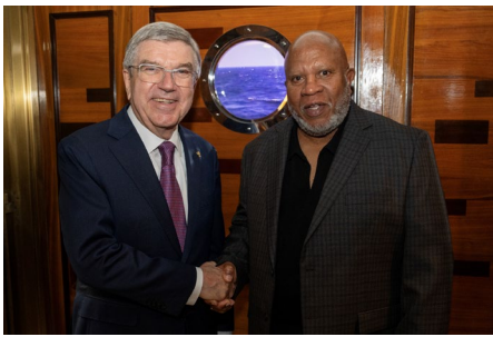
Le président avec le président de l'AGNU, Dennis Francis.

En amont de la présentation du projet de résolution sur la Trêve olympique à l'Assemblée générale des Nations Unies à New York, le président du CIO a rencontré le secrétaire général de l'ONU, António Guterres. Les deux dirigeants ont discuté de la situation géopolitique actuelle dans le monde et de son impact sur le sport. Tous deux ont souligné la contribution du sport à la promotion de la paix et de la compréhension mutuelle. Ils ont insisté sur l'importance de la neutralité politique et de l'autonomie du sport pour que le Mouvement olympique soit à la hauteur de sa mission, qui est d'unir le monde dans une compétition pacifique avec la participation de tous. Cela signifie également que les événements sportifs doivent être organisés par des organisations sportives et non par des gouvernements. Le président du CIO a invité le secrétaire général des Nations Unies aux Jeux de Paris. Le secrétaire général des Nations Unies a salué les initiatives prises par le CIO pour atteindre les objectifs de développement durable, mettant notamment l'accent sur l'égalité des genres, la santé, la durabilité, la protection du climat et les réfugiés. Il a également exprimé sa confiance