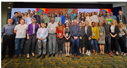
Participants au cours avancé du CIO pour médecins d'équipe à Medellín.