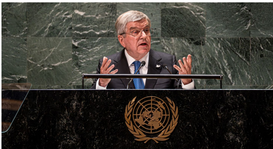
Le président Bach s'adresse à l'Assemblée générale des Nations Unies à New York.