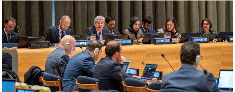
Le président Bach lors de la réunion organisée par le Groupe des amis du sport des Nations Unies.

En amont de la présentation du projet de résolution sur la Trêve olympique à l'Assemblée générale des Nations Unies à New York, le président du CIO a rencontré le secrétaire général de l'ONU, António Guterres. Les deux dirigeants ont discuté de la situation géopolitique actuelle dans le monde et de son impact sur le sport. Tous deux ont souligné la contribution du sport à la promotion de la paix et de la compréhension mutuelle. Ils ont insisté sur l'importance de la neutralité politique et de l'autonomie du sport pour que le Mouvement olympique soit à la hauteur de sa mission, qui est d'unir le monde dans une compétition pacifique avec la participation de tous. Cela signifie également que les événements sportifs doivent être organisés par des organisations sportives et non par des gouvernements. Le président du CIO a invité le secrétaire général des Nations Unies aux Jeux de Paris. Le secrétaire général des Nations Unies a salué les initiatives prises par le CIO pour atteindre les objectifs de développement durable, mettant notamment l'accent sur l'égalité des genres, la santé, la durabilité, la protection du climat et les réfugiés. Il a également exprimé sa confiance