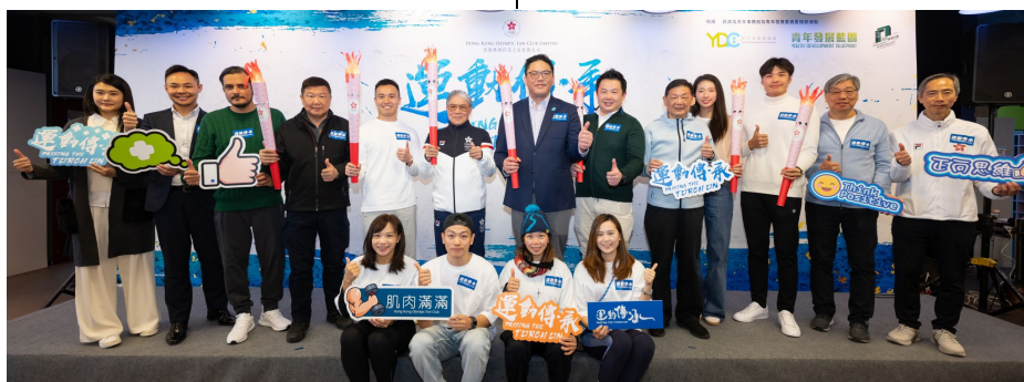
Lancement du programme "Passing The Torch On" du fan club du CNO de Hong Kong, Chine.

Pour marquer son fort engagement à l'éducation des athlètes, le CNO a organisé tout au long du mois de janvier 2024 des ateliers visant à doter les athlètes d'outils nécessaires pour réussir dans leur carrière après s'être retiré de la compétition. Ainsi, plus de 80 athlètes jordaniens ont participé au programme Athlete 365 Career+ , mis en place par le CIO. Organisé par l'Académie olympique jordanienne, plusieurs sujets ont été abordés, notamment les compétences de vie, l'éducation et l'emploi, allant de la découverte de