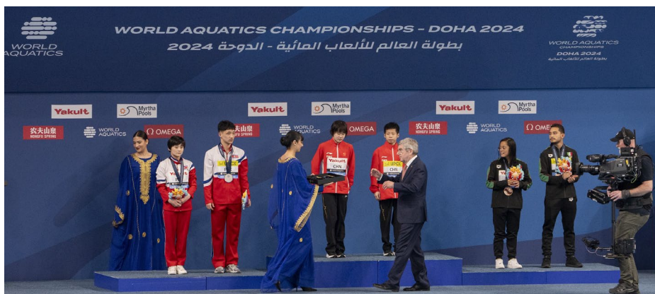
Le président Bach remettant les médailles du plongeur synchronisé mixte, plateforme de 10m.

géopolitique et de son impact sur le sport, ainsi que d'autres sujets d'intérêt commun.