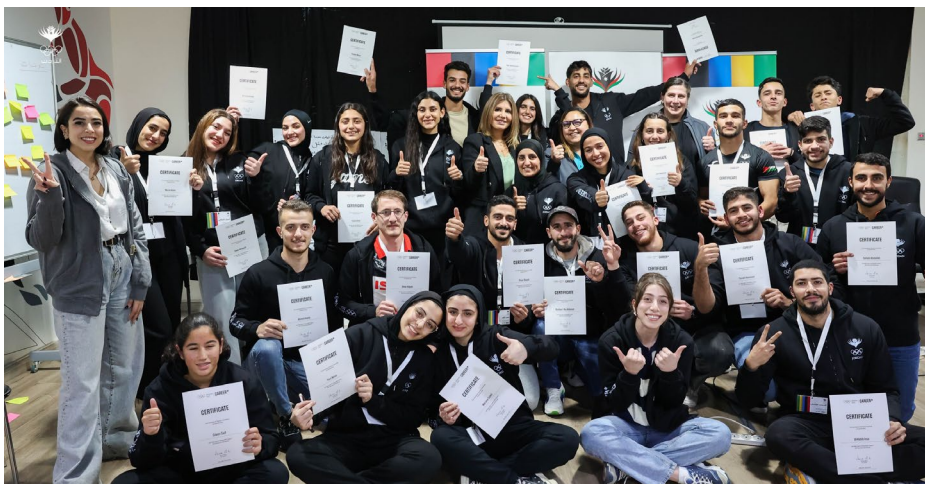
Des athlètes jordaniens ont participé au programme Athlete 365 Career+ .