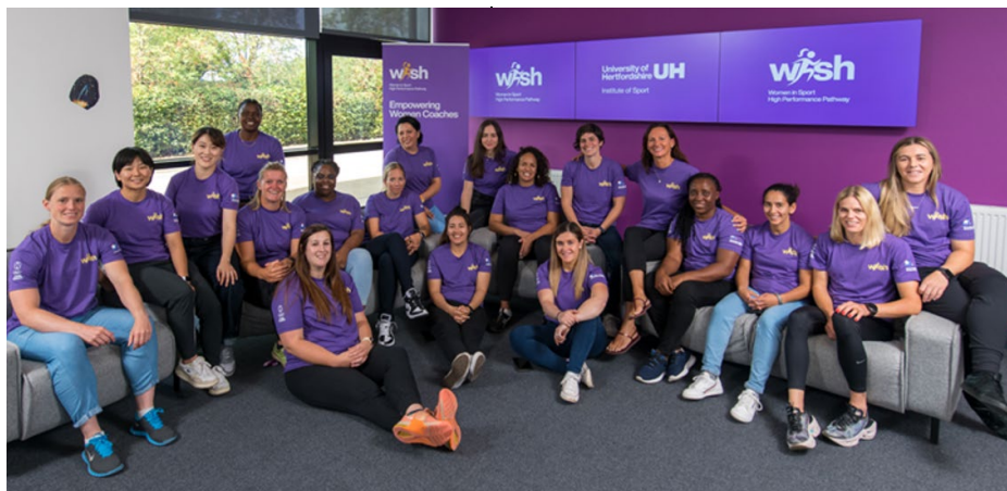
Les diplômées de la première promotion du programme WISH.

La cérémonie de remise des diplômes de la première promotion du programme Women in Sport High Performance Pathway – WISH s'est déroulée à distance le 22 janvier. Les 17 entraîneuses récemment diplômées ont assisté à cet événement depuis divers endroits dans le monde et dans différents fuseaux horaires. Axé sur le leadership et l'entraînement, et soutenu par la Solidarité Olympique, le programme WISH est composé d'un séjour d'une semaine à l'Université du Hertfordshire au Royaume-Uni, suivie de cours en