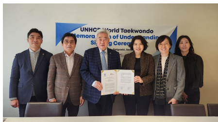
Signature du protocole d'accord entre World Taekwondo et le HCR.