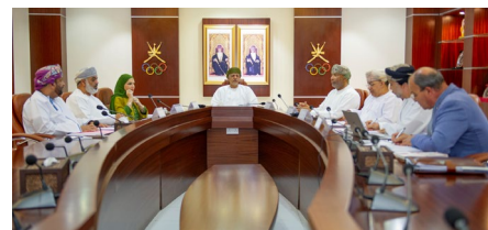
Réunion du conseil d'administration du CNO d'Oman.