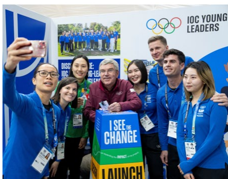
Le président du CIO avec les jeunes leaders et les jeunes reporters du CIO.

Il a aussi rencontré les jeunes leaders du CIO qu'il a félicité pour leur engagement à utiliser le pouvoir du sport pour faire la différence au sein de leurs communautés, et pour partager cet objectif avec les jeunes athlètes. Avec les jeunes reporters du CIO , il a parlé de différents sujets tels que l'intelligence artificielle et l'importance d'amener les Jeux Olympiques sur le sol africain.