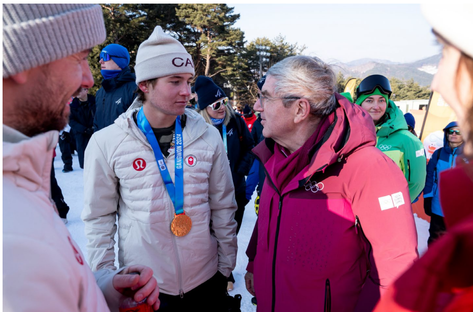
Le président avec le Canadien Eli Bouchard, médaillé d'or de big air en snowboard aux JOJ Gangwon 2024.

Le président du CIO a visité le Samsung Galaxy Olympic Games Experience Centre , situé dans le parc olympique de Gangneung, où il a eu l'occasion de se familiariser avec diverses fonctionnalités d'intelligence