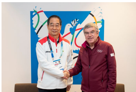
Le président Bach et le premier ministre coréen, Han Duck-soo.

Auparavant, le président s'est entretenu avec le premier ministre de la République de Corée, Han Duck-soo auquel il a exprimé ses félicitations pour le succès des Jeux de Gangwon 2024. Ils ont également discuté de la situation géopolitique actuelle.