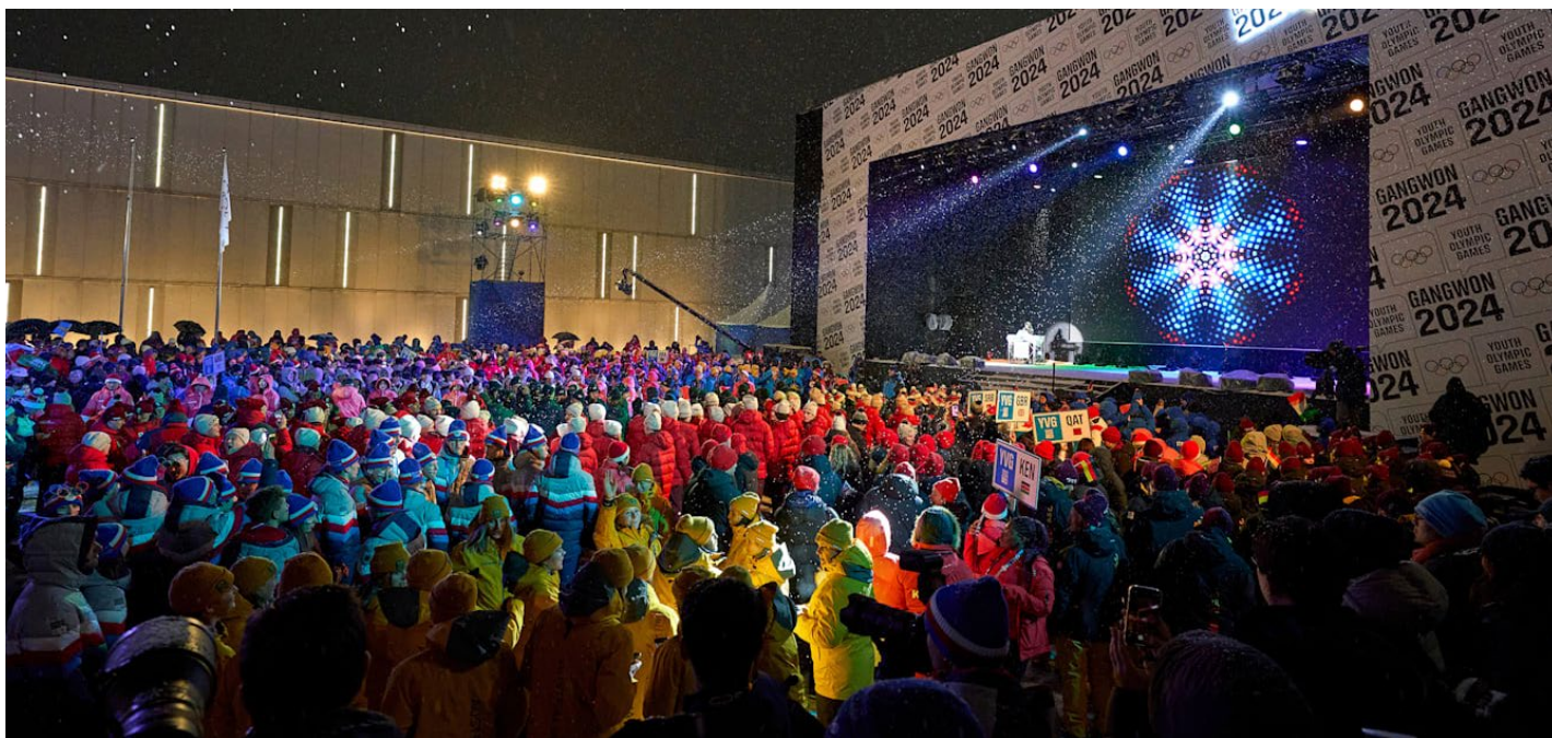
Les jeunes athlètes se sont rassemblés pour la cérémonie de clôture des Jeux Olympiques de la Jeunesse d'hiver Gangwon 2024.