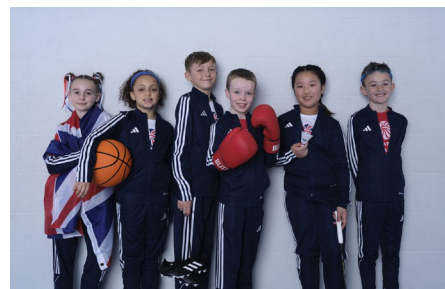
Les enfants sélectionnés pour être les toutes premières mini-mascottes de l'équipe britannique.