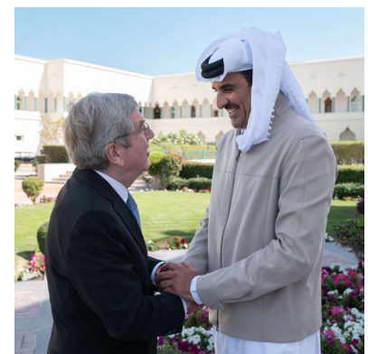
À Doha, le président a rencontré l'émir du Qatar, le Cheik Tamim Bin Hamad Al -Thani.

Le président s'est entretenu avec l'émir du Qatar, le Cheik Tamim Bin Hamad Al -Thani, également membre du CIO. Ils ont parlé de la situation