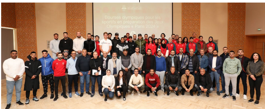
Rassemblement de sportifs marocains boursiers et de leur encadrement technique.

Le 31 janvier, soit 6 mois avant le début des Jeux de Paris 2024, ont été dévoilés les visages de celles et ceux qui auront la chance de s'élancer sur le même parcours que les marathoniens et marathoniennes olympiques le soir du 10 août 2024. En parallèle de ce Marathon Pour Tous, un Marathon Pour Tous Connecté débutera le samedi 10 août à 8h00, alors qu'au même moment le marathon olympique masculin s'élancera depuis le parvis de l'Hôtel de Ville de Paris. Paris 2024 invitera le grand public partout dans le monde à participer à cette grande course connectée pour célébrer les Jeux et le sport. Les coureurs devront courir au moins 30 minutes pour que leur participation soit prise en compte. Communiqué complet ici .