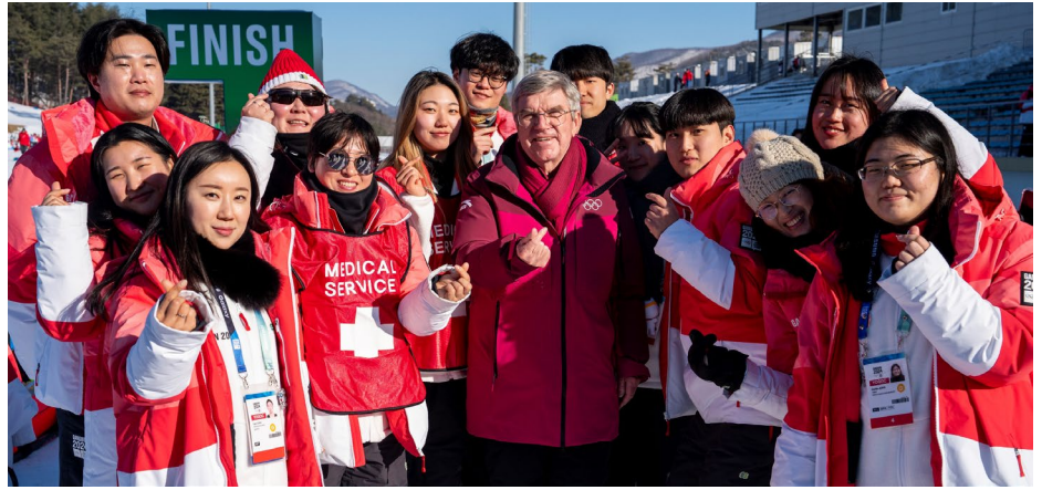
Le président Bach avec des volontaires lors de la finale du combiné nordique.

Lors d'une cérémonie à Gangneung, le président Bach a remis l'Ordre olympique à Yoon Se-young, fondateur du groupe Seoul Broadcasting System (SBS), en reconnaissance de sa contribution à la promotion du Mouvement