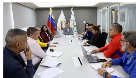
Réunion avec les fédérations sportives vénézuéliennes.

soi à la création de CV. De plus, des ateliers offraient la possibilité d'apprendre auprès d'autres athlètes et olympiens. Plus d'infos ici .