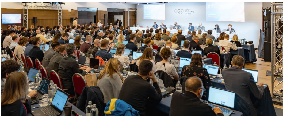
Réunion des diffuseurs mondiaux organisée par OBS à Cortina d'Ampezzo.