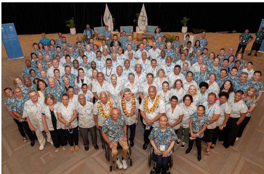
Le président du CIO à l'Assemblée générale de l'ONOC aux Fidji.