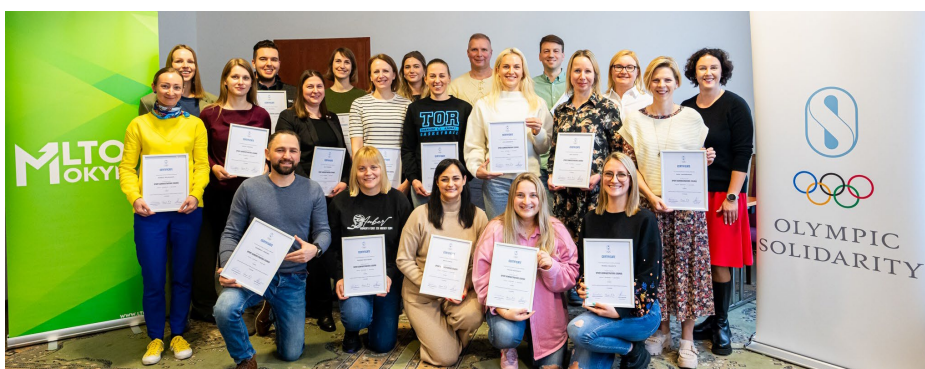
Les participants à la formation en administration sportive organisée par le CNO lituanien.

considérable ses athlètes dans leur double carrière. L'événement a été organisé dans le contexte du projet financé par l'Union européenne visant à promouvoir la double carrière, baptisé 'Comités olympiques pour la double carrière – OCDC ( Olympic Committees for Dual Career )'. Lire ici tous les détails sur les projets et la liste des athlètes honorés.