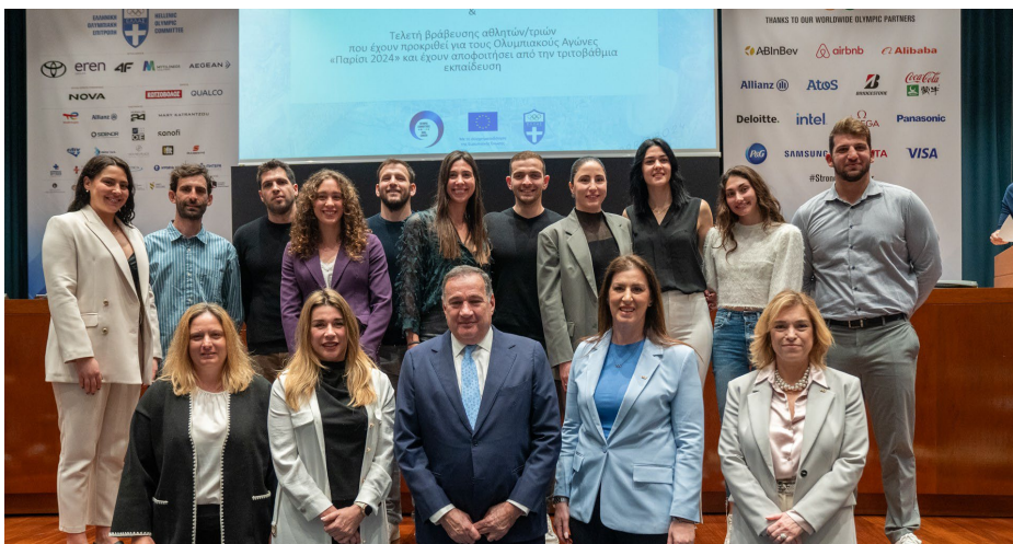
Des athlètes mis à l'honneur par le CNO hellénique.