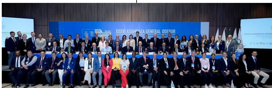
Les participants à l'Assemblée générale de l'ODESUR.

Les organes institutionnels de la FICTS (conseil d'administration, membres des quatre commissions internationales, auditeurs et ambassadeurs) ont approuvé les lignes directrices pour la période 2024-2027, pour la promotion des valeurs olympiques et de la culture sportive, et ce en accord avec Milano Cortina 2026. Lors du premier semestre 2024, les événements suivants auront lieu. Du 8 au 10 mai, à Milan, la finale "Trofei di Milano Cortina 2026" rassemblera 42000 élèves de 70 écoles de Lombardie et de Vénétie. Du 6 au 8 juin, les villes de Vérone, Trévise et Venise accueilleront le projet "GenerAZIONE2026 - Sport powered by youth and education", qui est inclus dans le programme "Education