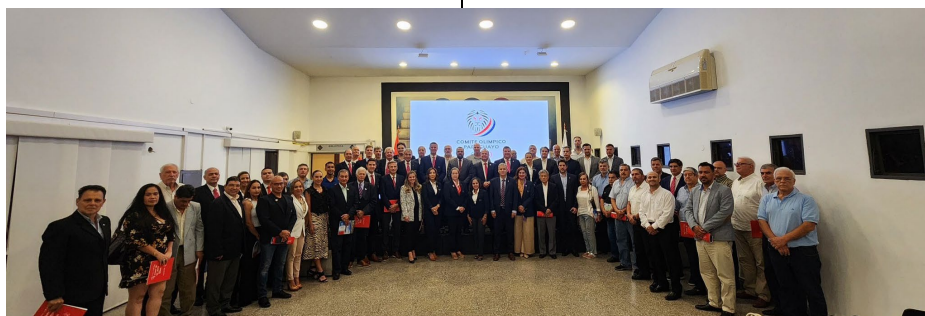
Assemblée générale ordinaire du CNO paraguayen.

des entraîneurs venus de 11 nations. Organisé par la Fédération espagnole et financé par la Solidarité Olympique, le camp avait comme objectif de doter les jeunes athlètes de compétences et de ressources nécessaires pour faire progresser leur carrière en ski-alpinisme. Le camp a été également une occasion unique d'échange culturel, favorisant l'unité et la collaboration entre les participants venus d'horizons divers. Tous les détails ici .