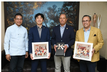
Rencontre avec des dirigeants de taekwondo au CNO de la République dominicaine.

taekwondo sur le continent américain et dans le monde ainsi que des Jeux Olympiques et Paralympiques Paris 2024. Les deux dirigeants étaient à Saint-Domingue à l'occasion du tournoi régional de qualification pour ces Jeux. Plus de détails ici .