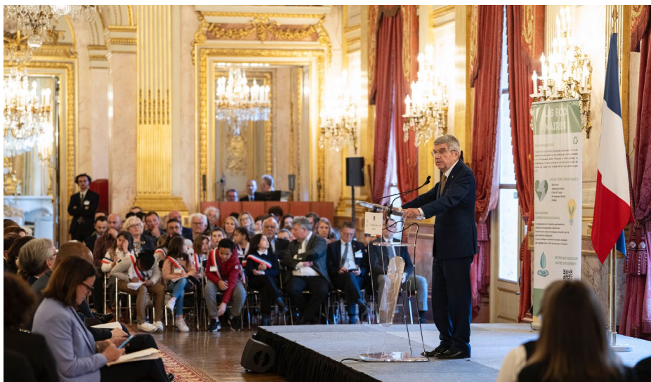
Le président Bach s'est adressé à l'Association Les Éco Maires à l'Assemblée nationale.

Le président du CIO s'est par ailleurs rendu au siège du comité d'organisation des Jeux Olympiques et Paralympiques Paris 2024 où il a été accueilli par son président, Tony Estanguet. Ils ont discuté des derniers développements très positifs en date réalisés dans les préparatifs des Jeux. Le président Thomas Bach a réaffirmé la pleine confiance du CIO dans le comité d'organisation sous la conduite de Tony Estanguet.