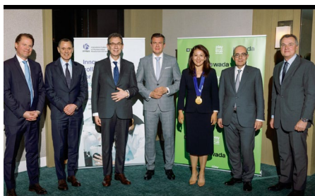
Rencontre entre l'AMA et l'IFPMA à Athènes.