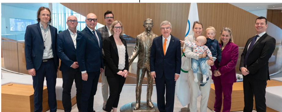
Le président du CIO avec les membres du comité exécutif de l'IBSF.