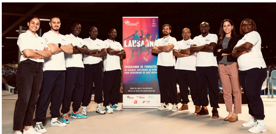
Les nouveaux entraîneurs diplômés du PAISAC.

et de renforcer la collaboration en vue d'un échange d'informations fructueux, avant et pendant ces grands événements. Détails complets ici .