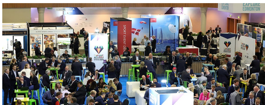
Le Sommet SportAccord World Sport & Business 2024 à Birmingham.