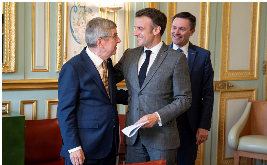
Le président Thomas Bach a rencontré le président français, Emmanuel Macron, avec le président du CNOSF et membre du CIO, David Lappartient.

Avec le conseil de l'Association des fédérations internationales de sport reconnues par le CIO (ARISF),