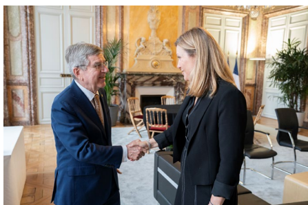
Le président du CIO avec la présidente de l'Assemblée nationale, Yaël Braun-Pivet.