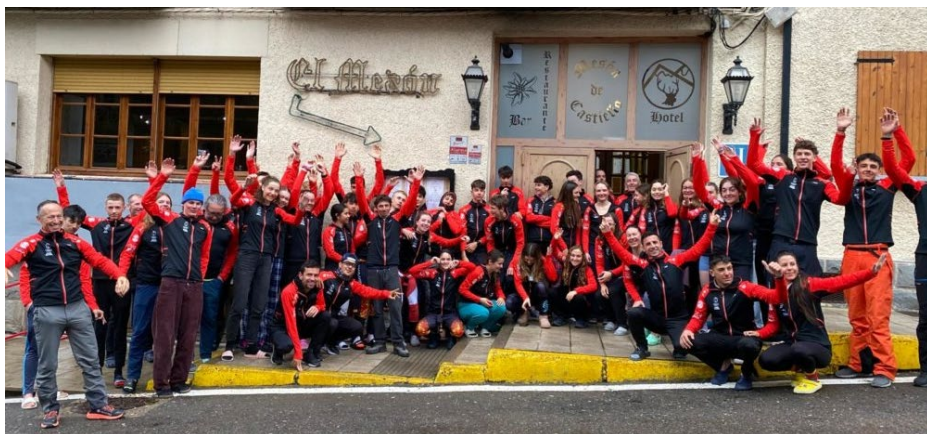
Les participants au camp de formation de la Solidarité Olympique/ISMF à Candanchu.