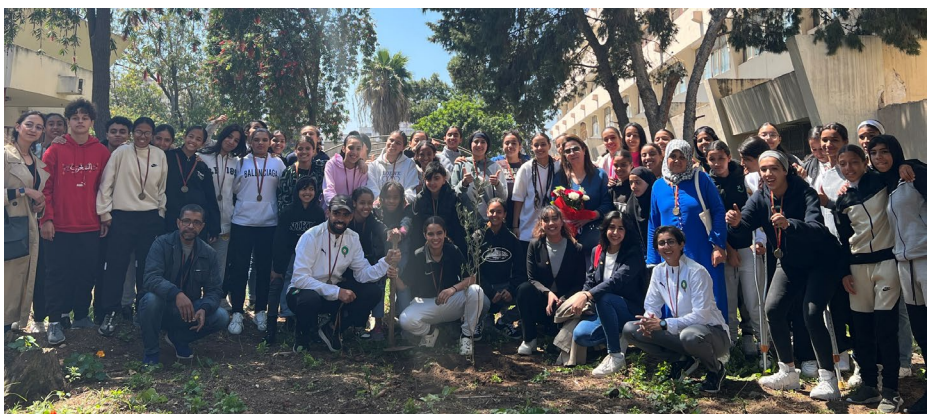
Le CNO marocain a célébré la Journée internationale du sport au service du développement et de la paix.