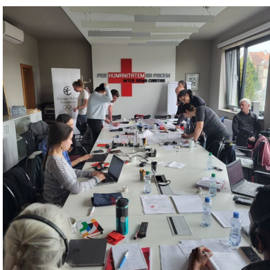
Les participants à la formation Sport Coach + à Prague.

Le Sommet SportAccord World Sport & Business 2024 a rassemblé plus de 1 700 participants venus de 65 pays pendant une semaine à Birmingham, Grande-Bretagne. Au programme, des rencontres de haut niveau, des conférences, des expositions, du réseautage et des événements sociaux. Les sujets de discussion et de débat allaient de la durabilité, des technologies innovantes, de l'engagement des fans et des nouveaux modèles d'événements à la