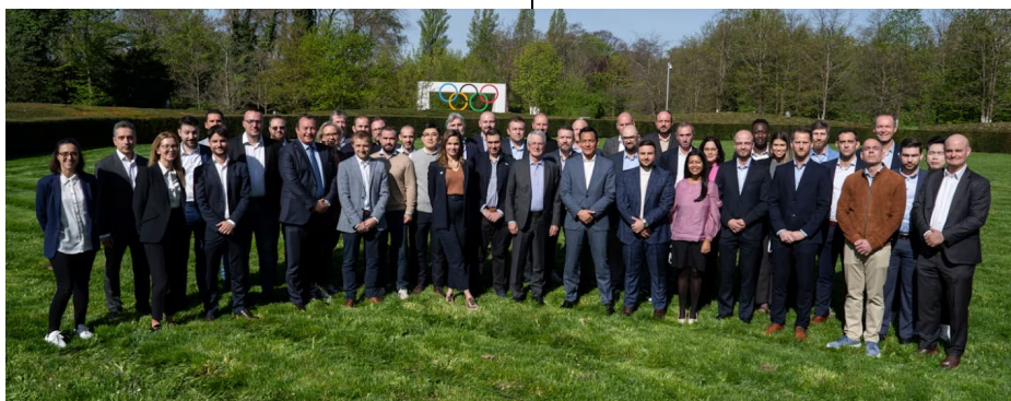
Les participants à l'atelier CIO-UEFA à la Maison Olympique.

La protection de l'intégrité des paris sportifs au moyen d'une collaboration intersectorielle a été au centre d'un récent atelier d'une journée, organisé conjointement par le CIO et l'UEFA à l'intention des organismes de paris et des FI. Avec les Jeux Olympiques Paris 2024 et l'UEFA EURO 2024 à l'horizon, cet atelier qui s'est tenu le 11 avril à la Maison Olympique à Lausanne, a été l'occasion d'aligner les approches des organisations sportives et des organismes de paris, de tirer des enseignements mutuels